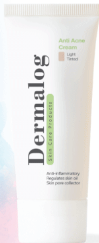
رنگی روشن |