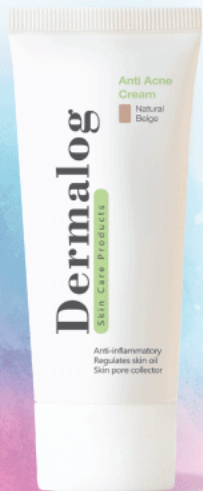
بژ طبیعی |